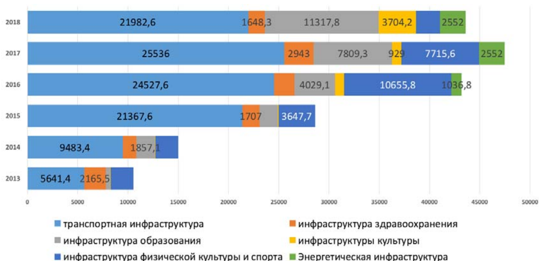
Рис. 2. Динамика программных расходов на развитие инфраструктуры в рамках государственных программ субъектов Российской Федерации, млн руб. 8

Как видно из представленных данных, на территории ДФО продолжает сохраняться высокая потребность в инициировании проектов ГЧП. Первостепенной проблемой является отсутствие проектов в области культуры, а также недостаточное количество проектов в сфере транспорта, энергетики, здравоохранения и спорта. Все это объясняется неразвитостью объектов инфраструктуры, транспортной системы и инженерных коммуникаций на данной территории. Наиболее распространенными инструментами ГЧП на текущий момент являются концессионные механизмы и соглашение о государственно-частном партнерстве.