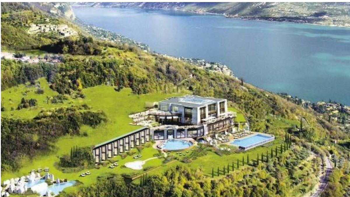
Рис. 3. Отель Lefay Resort &amp; SPA Lago di Garda

Отель Saffire Freycinet в Тасмании использует энергосберегающие окна с солнечными панелями, что позволяет постояльцам пользоваться энергией солнца, экономя электричество. Для приготовления пищи на кухне применяют только местные фермерские продукты, а персонал пользуется органическими моющими средствами.