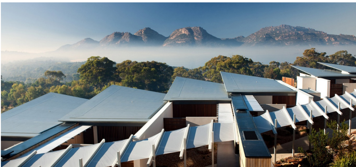
Рис. 4. Отель Saffire Freycinet

Отель Saffire Freycinet в Тасмании использует энергосберегающие окна с солнечными панелями, что позволяет постояльцам пользоваться энергией солнца, экономя электричество. Для приготовления пищи на кухне применяют только местные фермерские продукты, а персонал пользуется органическими моющими средствами.