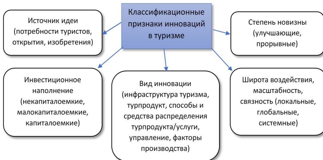
Рис. 1. Классификационные признаки инноваций в туризме

Деятельность большинства туристических компаний ориентирована на разработку новой продукции согласно потребностям своих клиентов и совершенствование уже имеющихся услуг, пользующихся широким спросом [3].