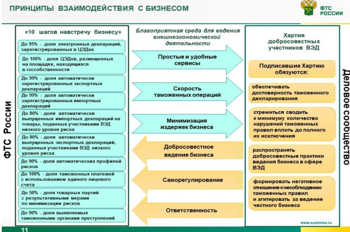
Рис. 1. Ключевые показатели «10 шагов навстречу бизнесу» [2]

Однако наряду с ключевыми показателями оценки качества таможенных услуг также существует так называемая система показателей эффективности деятельности таможенных органов Российской Федерации.