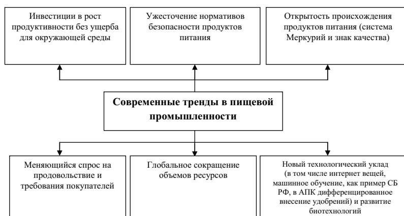
Рис. 1. Современные тренды в пищевой промышленности России

Учитывая главный тренд 2018 года о переориентации с импортозамещения на развитие экспорта (зафиксировано майским указом президента), а также современные тренды в пищевой промышленности России (рис. 1), пришли к выводу о том, что перспективным направлением в управлении АПК является совершенствование социально-экономического механизма на основе развития сетевых взаимодействий.