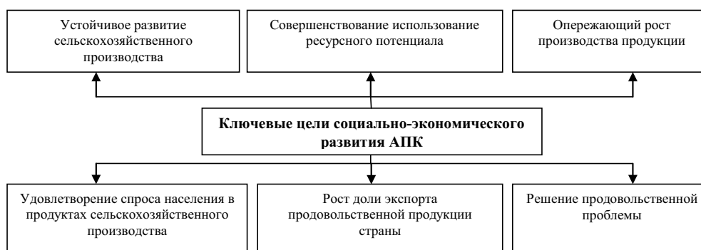
Рис. 3. Ключевые цели социально-экономического развития АПК

Задачей совершенствования механизма управления АПК является социально-экономический эффект, обеспечивающий устойчивое развитие агропродовольственной сферы. Исходя из этого определены ключевые цели социально-экономического развития агропродовольственного комплекса (рис. 3).