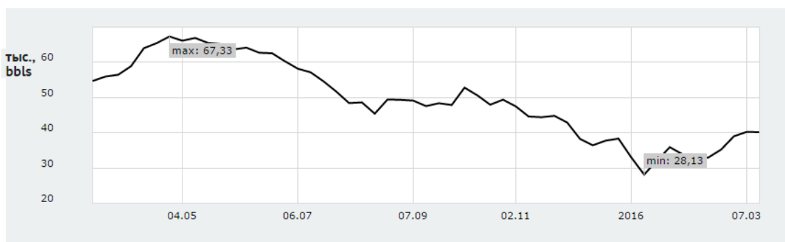
График 2. Динамика цен на нефть Brent за несколько месяцев (долл. за баррель)

В связи с падением цен на нефть ЦБ России был вынужден повышать курсы доллара и евро по отношению к российскому рублю. Это обусловлено тем, что девальвация рубля повышает цену за баррель нефти в рублях. Таким образом, видно, что курс рубля напрямую зависит от мировых цен на нефть. Падение цен на нефть приводит к обесценению российского рубля (как видно из графика 3) [9].