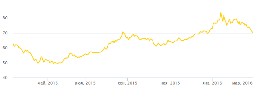
График 3. Динамика курса доллара США к рублю (USD, ЦБ РФ)

Многие товары импортируются в Россию из других стран. Соответственно, при девальвации российского рубля их цена в рублях повышается. Из этого следует, что девальвация рубля может вызвать инфляцию. На рис. 4 приведен уровень инфляции по годам [10].