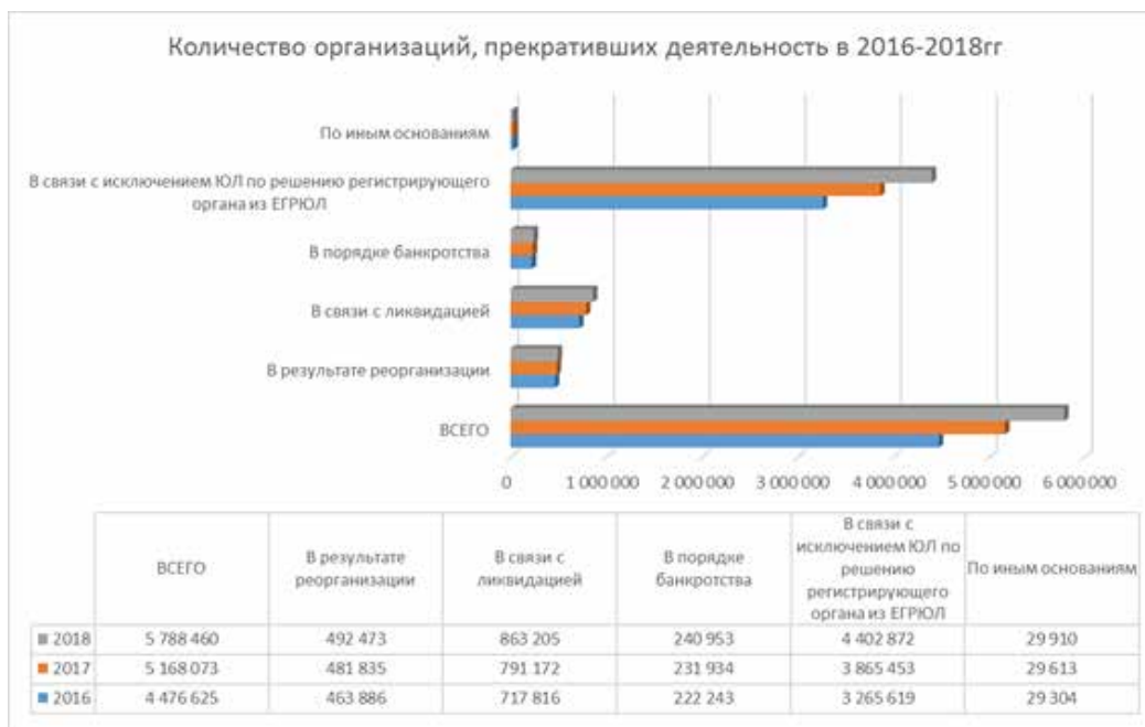
Рис. 2 Количество организаций, прекративших деятельность в 2016–2018 гг.