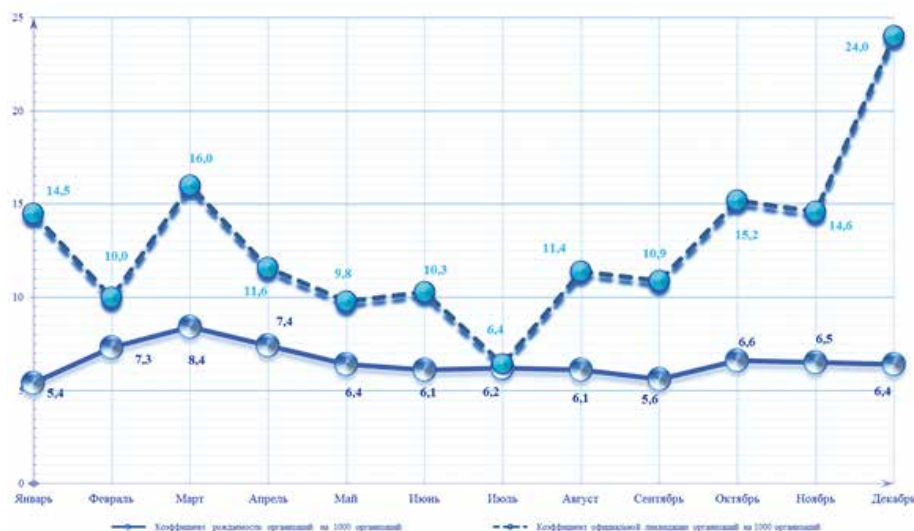
Рис. 3 Показатели демографии организаций в целом по Российской Федерации в 2018 г.

Для детального исследования демографического состояния организаций в 2018 году исследуем показатели демографии организаций в целом по Российской Федерации в 2018 г, поскольку в данном периоде наблюдались самые неблагоприятные показатели.